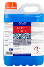
DSP.5.5 BACT LAVAVAJILLAS MANUAL SIN PERFUME FORMATOS: 5L PT02962100