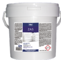
ZAS PASTA HUMECTANTE DESENGRASANTE. FORMATOS 4KG PT00221400