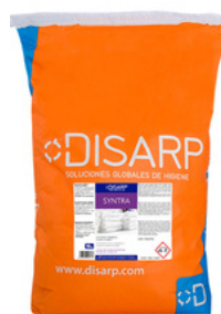
SINTRA DETERGENTE ATOMIZADO FORMATOS 10KG PT00236000