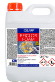
EFICLOR FOAM DESINFECTANTEALCALINO CLORADO ALTA ESPUMA FORMATOS: 5L PT06852100