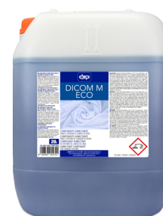
DICOM M ECO ESPUMA CONTROLADA ELEVADO PODER HUMECTANTE Y EMULSIONANTE FORMATOS 20L PT05382700