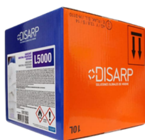
L5000 SUAVIZANTE PARA DILUCIÓN. FORMATOS ECODISBOX PT0674B300