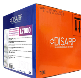
L7000 BLANQUEANTE ÓPTICO DEL SISTEMA DE LAVADO DE ROPA FORMATOS ECODISBOX 10L PT0674B300