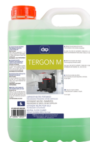
TERGÓN M LIMPIADOR NEUTRO PERFUMADO. MÁQUINAS FREGADORAS FORMATOS: 5L PT01882100