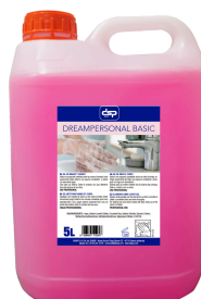
DREAMPERSONAL BASIC GEL DEMANOS YCUERPO FORMATOS 5L PT08142100