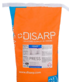
PRESS DETERGENTE EN POLVO FORMATOS 10KG PT00205800