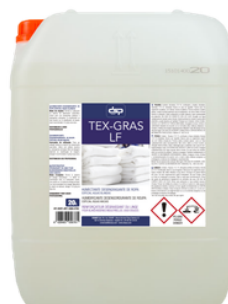
TEX GRAS LF HUMECTANTE DESENGRASANTE DE ROPA BAJA ESPUMA FORMATOS 20KG PT03652700