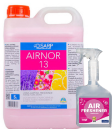
AIRNOR 13 AMBIENTADOR PERSISTENTE FLORAL INTENSO FORMATOS: 5L/12x500ml PT04522100 5L PT0452F100 12x500ml