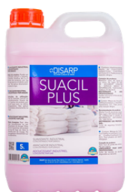
SUACIL PLUS SUAVIZANTE INDUSTRIAL CONCENTRADO PERFUMADO FORMATOS 5L / 20L PT01772100 5L PT01772700 20L