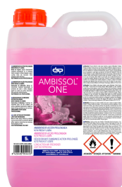
AMBISSOL ONE NOTA FRESCA Y LIGERA FORMATOS: 5L PT04892100