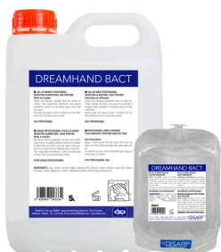
DREAMHAND BACT GEL DE MANOS PROFESIONAL SIN PERFUME FORMATOS 5L / ECO Z PT02512100. 5L PT0441F100 12x500ml