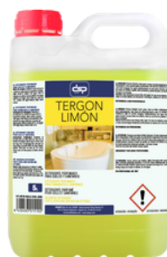
TERGÓN LIMÓN DETERGENTE SUELOS PERFUMADO FORMATOS: 5L PT01162100