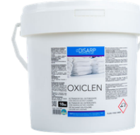
OXICLEN ACTIVADOR DEL DETERGENTE CON OXIGENO ACTIVO Y ENZIMAS FORMATOS 10KG PT00181400