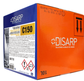
C150 DETERGENTE CONCENTRADO AGUAS DURAS FORMATO: ECODISBOX 10L PT0545B300