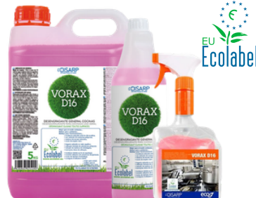
VORAX D-16 BAJA ALCALINIDAD TODO TIPO DE SUPERFICIES FORMATOS: 5L / 9*1L / 12*500ml PT01922100 5L PT01927500 9*1L PT0192F100 12*500ml