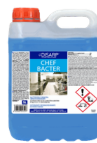
CHEF BACTER HA DESINFECTANTE DESENGRASANTE FORMATOS: 5L PT02492100