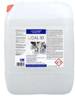
LIDAL 30 DETERGENTE ESPECIAL ALUMINIO FORMATOS: 24KG PT01548200