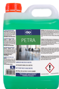
PETRA LIMPIASUELOS BIOALCOHOL NEUTRO. ESPECIAL GRES Y CERÁMICOS FORMATOS: 5L PT02662100