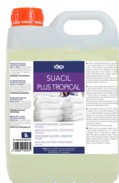
SUACIL TROPICAL SUAVIZANTE INDUSTRIAL CONCENTRADO PERFUMAD FORMATOS 5L / 20L PT01782100 5L PT01782700 20L