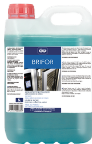
BRIFOR ABRILLANTADOR LIMPIEZA HORNOS FORMATOS: 5L PT00712100