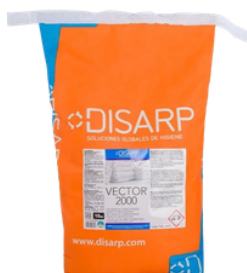
VECTOR 2000 DETERGENTE SÓLIDO CONCENTRADO. FORMATOS 10 KG / 20KG PT00296200 10KG PT00296300 20KG