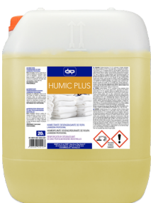
HUMIC PLUS HUMECTANTE DESENGRASANTE FORMATOS 20KG PT04472700