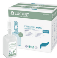
JABÓN ESSENTIAL HAND SOAP JABÓN MANOS FORMATOS 6x1000ml 89811000