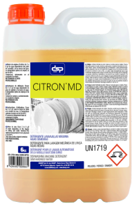
CITRÓN MD DETERGENTE AGUAS MEDIAS FORMATOS: 12 KG / 24KG PT00792500 12KG PT00798200 24KG