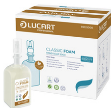
IDENTITY CLASSIC GEL JABÓN MANOS FORMATOS 6x1000ml 89111000