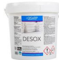
DESOX RECUPERADOR TEXTIL. MANCHAS DE HIERRO FORMATOS 3,5KG PT00078000