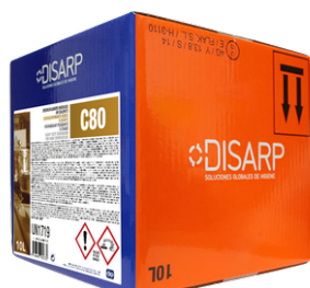
C80 DESENGRASANTE ENÉRGICO EN CALIENTE FORMATOS: ECODISBOX 10L PT0376B300