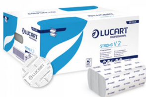
STRONG V2 TOALLAS PLEGADO EN V. FORMATOS: 20 863045