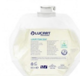
IDENTITY LUXURY FOAM SOAP REFIL JABÓN EN ESPUMA FORMATOS 6X800ML 892298R