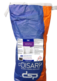
KENTIA DETERGENTE ATOMIZADO FORMATOS 10KG / 20KG PT03085600 10KG PT03084700 20KG