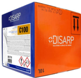
C100 DETERGENTE CONCENTRADO FORMATO: ECODISBOX 10L PT0515B300