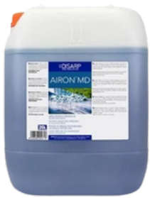
AIRÓN MD ABRILLANTADOR AGUAS MEDIAS FORMATOS: 10L / 20L PT00392300 10L PT00392700 20L