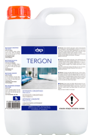
TERGÓN LIMPIASUELOS BIOALCOHOL NEUTRO PERFUMADO FORMATOS: 5L PT01882100