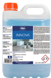
INNOVA DETERGENTE MULTISUPERFICIES MARINO FORMATOS: 5L PT02602100