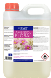
AMBISSOL FORAL NOTA FEMENINA SINFONÍA DEFLORES FORMATOS: 5L PT03972100