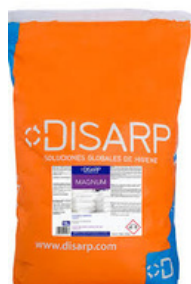
MAGNUM DETERGENTE ATOMIZADO FORMATOS 10KG / 20 KG PT00156400 10 KG PT00156500 20 KG