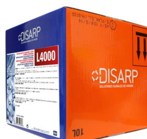
L4000 NEUTRALIZANTE CONCENTRADO FORMATOS ECODISBOX 10L PT0640B300