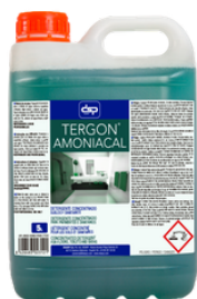
TERGÓN AMONIACAL DETERGENTE CONCENTRADO PERFUMADO PINO FORMATOS: 5L PT01822100 5L