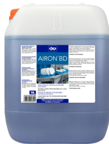
AIRÓN BD ABRILLANTADOR AGUAS MEDIAS FORMATOS: 10L / 20L PT00402300 10L PT00402700 20L