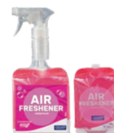
FRAGANCIA ZAFIRO AMBIENTADOR NOTA SENSUAL Y ELEGANTE FORMATOS: 12x500ml PT0722F100