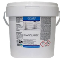
BLANQUIBEL BLANQUEANTE CLORADO EN POLVO FORMATOS 12KG PT00031500