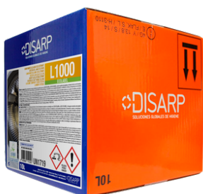
L1000 DETERGENTE ALCALINO. FORMATOS ECODISBOX 10L PT0631B300