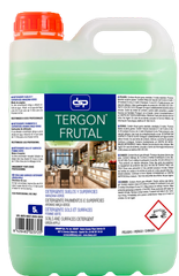
TERGÓN FRUTAL DETERGENTE PERFUMADO MANZANA VERDE FORMATOS: 5L PT01842100