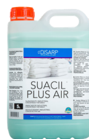
SUACIL PLUS AIR SUAVIZANTE INDUSTRIAL CONCENTRADO PERFUMAD ORMATOS 5L PT05432100