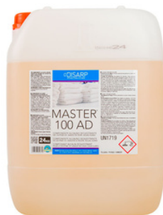
MASTER 100 AD COMPONENTE ALCALINO-SECUESTRANTE AGUAS DURAS FORMATOS 24KG PT01558200