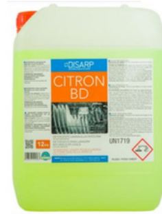
CITRÓN BD DETERGENTE AGUAS BLANDAS FORMATOS: 12KG / 24KG PT00812500 12KG PT00818200 24KG