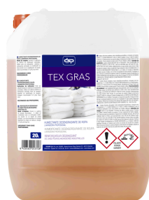
TEX-GRAS HUMECTANTE DESENGRASANTE ESPECIAL FORMATOS 20KG PT03652700