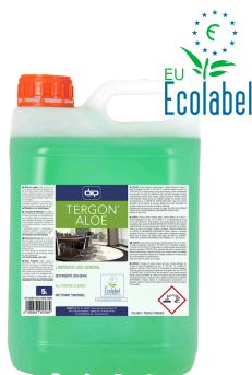
TERGÓN ALOE LIMPIADOR USO GENERAL RESPECTUOSO MEDIO AMBIENTE FORMATOS: 5L PT03302100