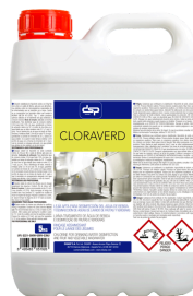
CLORAVERD LEJÍA PARA EL TRATAMIENTO DE AGUAS DE BEBIDA Y DESINFECCIÓN DE AGUA PARA LAVADO DEFRUTAS Y VERDURAS. FORMATOS: 5L PT03852100