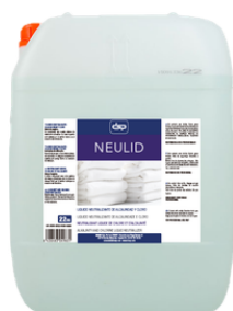
NEULID NEUTRALIZANTE LÍQUIDO DEALCALINIDAD Y CLORO FORMATOS 22L PT01638400