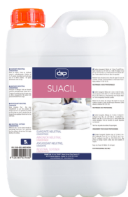
SUACIL SUAVIZANTE INDUSTRIAL CONCENTRADO FORMATOS 5L / 20L PT01752100 5L PT01752700 20L