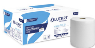
IDENTITY STRONG 155ID ROLLO SECAMANOS FORMATOS: 6U 861175