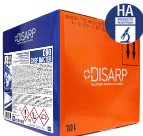
C90 DESINFECTANTE DESENGRASANTE FORMATOS: ECODISBOX 10L PT0249B300