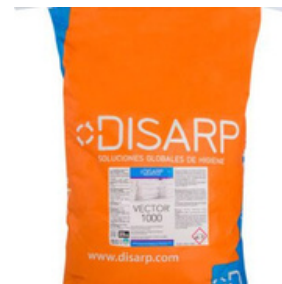
VECTOR 1000 DETERGENTE SÓLIDO. FORMATOS 10KG PT00285300