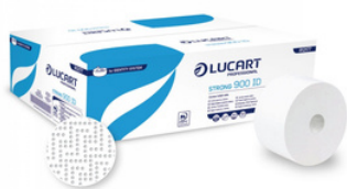
IDENTITY STRONG 900ID HIGIÉNICO INDUSTRIAL FORMATOS: 18U 812436