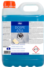
DOSPE AZUL LAVAVAJILLAS MANUAL CONCENTRADO NEUTRO FORMATOS: 5L / 9*1L PT03972100 5L PT01067400 9x1L