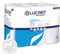
STRONG 18 PAPEL HIGIÉNICO EN ROLLO STANDARD FORMATOS: 108U 2123