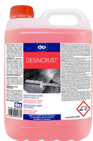
DESINCRUST DESINCRUSTANTE LÍQUIDO MÁQUINA. FORMATOS: 5L PT00922200