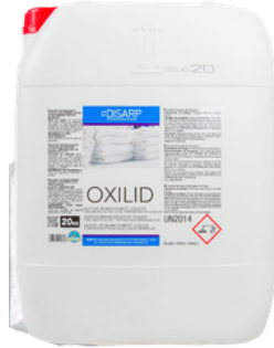
OXILID BLANQUEANTE LÍQUIDO CON OXÍGENO ACTIVO ALTAS TEMPERATURAS FORMATOS 20KG PT01662700