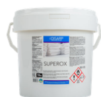
SUPEROX BLANQUEANTE OXIGENADO ENPOLVO FORMATOS 10KG PT00221400