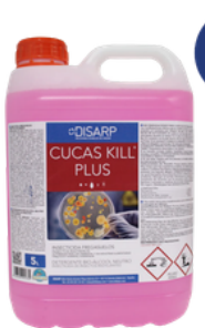
CUCAS KILL PLUS INSECTICIDA FREGASUELOS INSECTOS RASTREROS FORMATOS: 5L PT06452100