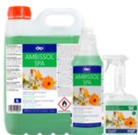
AMBISSOL SPA AMBIENTADOR, NOTA SENSUAL Y RELAJANTE FORMATOS: 5L/9x1L/ 12x500ml PT02602100 5L PT03967500 9x1L PT0396F100 12x500ml