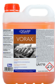
VORAX DESENGRASANTE GENERAL ALCALINO CONCENTRADO FORMATOS: 5L PT01972100