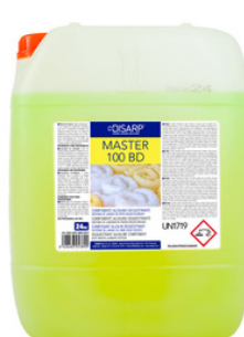
MASTER 100 BD COMPONENTE ALCALINO-SECUESTRANTE AGUAS BLANDAS FORMATOS 24KG PT01568200