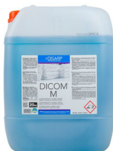
DICOM M COMPONENTE HUMECTANTE FORMATOS 20L PT00982700