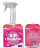
FRAGANCIA RUBÍ AMBIENTADOR NOTA FRESCA Y SENSUAL FORMATOS: 12x500ml PT0721F100