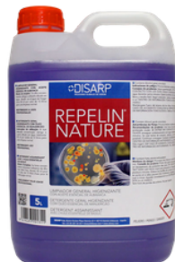
REPELÍN NATURE LIMPIADOR GENERAL CON ACEITE ESENCIAL DE ALBAHACA FORMATOS: 5L PT06442100