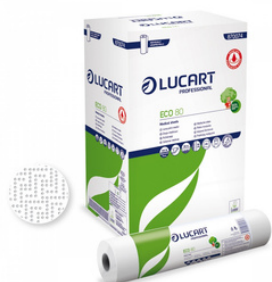
ECO 80 PAPEL DOBLE CAPA GOFRADO LAMINADO. FORMATOS: 1 870074U