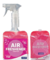
FRAGANCIA DIAMANTE AMBIENTADOR NOTA FRESCA Y LIGERA FORMATOS: 12x500ml PT0723F100