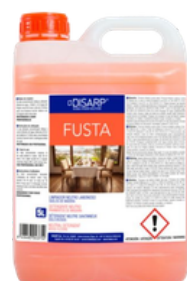
FUSTA LIMPIADOR NEUTRO JABONOSO SUELOS DE MADERA FORMATOS: 5L PT02762100