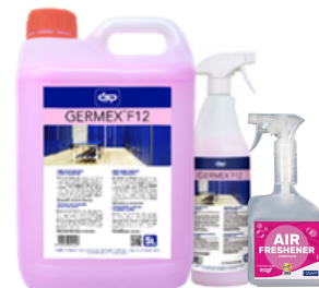
GERMEX F12 NOTA FEMENINA SINFONÍA DEFLORES FORMATOS: 5L/9x1L/ 12x500ml PT01192100 5L PT01197500 9x1L PT0119F100 12x500ml