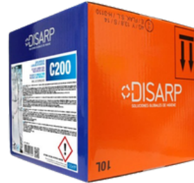
C200 ABRILLANTADOR CONCENTRADO FORMATO: ECODISBOX 10L PT0516B300