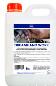
DREAMPERSONAL GEL&CHAMPÚ GEL DEDUCHA PARA PIEL Y CABELLO FORMATOS 5L PT05442100