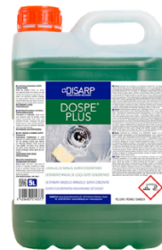
DOSPE PLUS LAVAVAJILLAS SUPERCONCENTRADO FORMATOS: 5L PT04892100