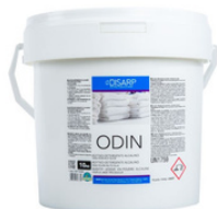
ODIN ADITIVO-DETERGENTE ALCALINO PARA ROPA MUY SUCIA FORMATOS 10 KG PT00171400