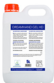
DREAMHAND GEL HD GEL NEUTRO DE MANOS FORMATOS: 5L PT07412100