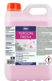
TERGÓN FRESH LDETERGENTE PERFUMADO SUELOS Y SANITARIOS EFECTO AMBIENTADOR FORMATOS: 5L PT06942100