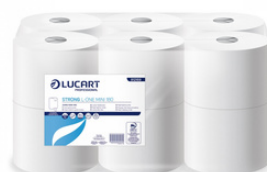
L-ONE MINI PASTA HIGIÉNICO INDUSTRIAL JUMBO FORMATOS: 12U 812501J