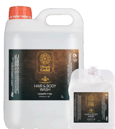
HAIR BODY WASH FÓRMULA COSMÉTICA 2 EN 1 FORMATOS: 5L / 1L / 300ml / 12x500ml PT09602100 5L PT09607400 1L PT0960F700 300ml PT0960F100 12*500ml