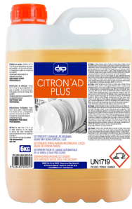
CITRÓN AD PLUS DETERGENTE AGUAS DURAS FORMATOS: 6 KG / 12KG / 24KG PT00802200 6KG PT00802500 12KG PT00808200 24KG