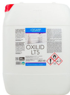
OXILID LT5 BLANQUEANTE LÍQUIDO CON OXÍGENO ACTIVO BAJAS TEMPERATURAS FORMATOS 20KG PT01682700