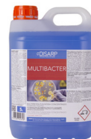
MULTIBACTER DESINFECTANTE.COND. LIMPIASUPERFICIES Y EQUIPOS FORMATOS: 5L PT02522100