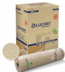
ECONATURAL 70 PAPEL DOBLE CAPA GOFRADO LAMINADO. FORMATOS: 1 870099