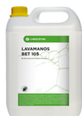
LAVAMANOS BET 105 JABÓN LÍQUIDO FORMATOS: 5L A1341438