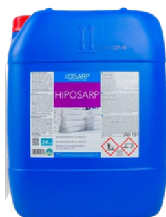
HIPOSARP BLANQUEANTE LÍQUIDO CLORADO FORMATOS 24KG PT01268200